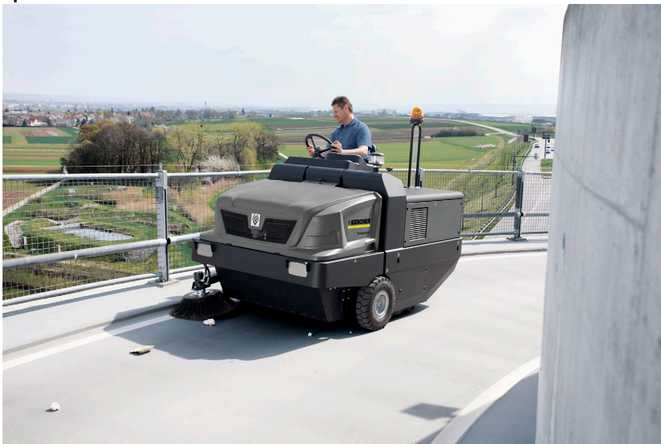
KM 150/500 R D Classic