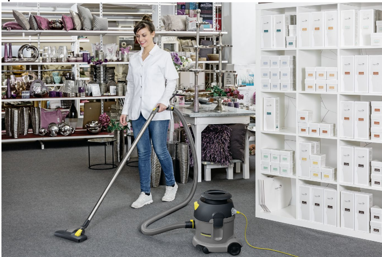
T 10/1 Adv